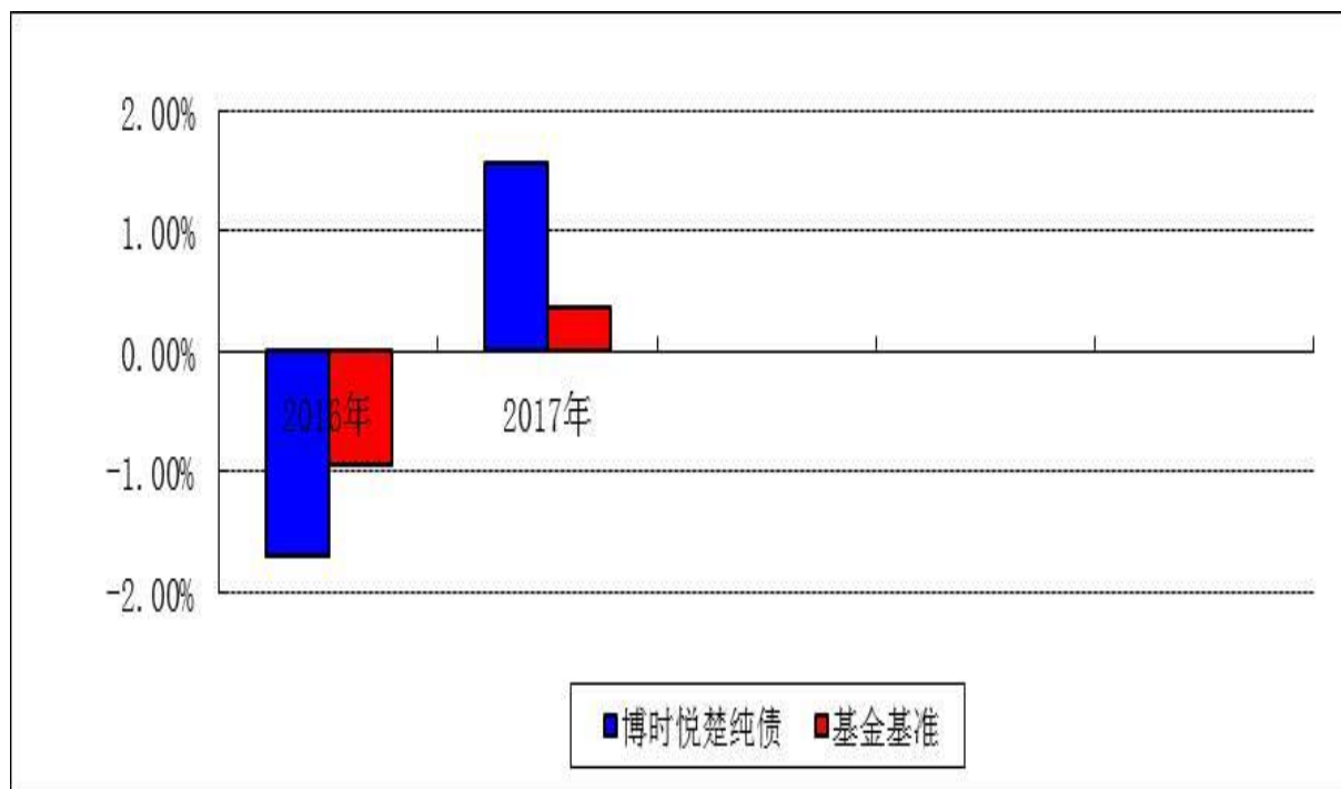
自基金合同生效以来基金净值增长率与业绩比较基准收益率的对比图