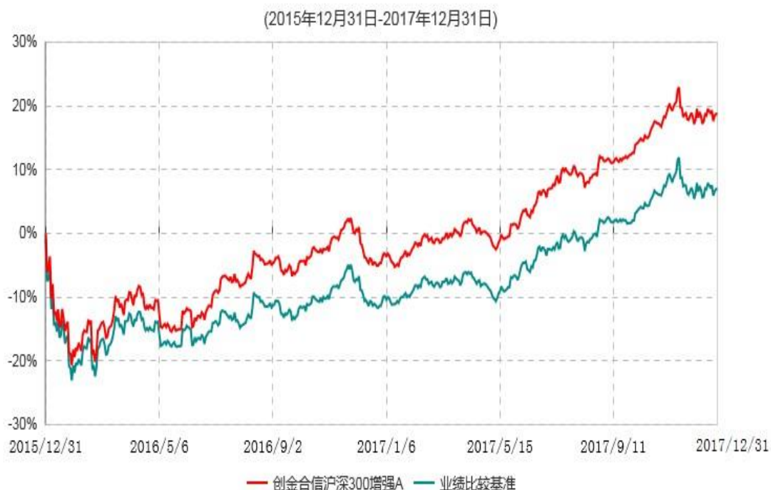
创金合信沪深300增强A累计净值增长率与业绩比较基准收益率历史走势对比图