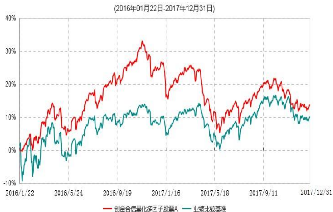
创金合信量化多因子股票A累计净值增长率与业绩比较基准收益率历史走势对比图