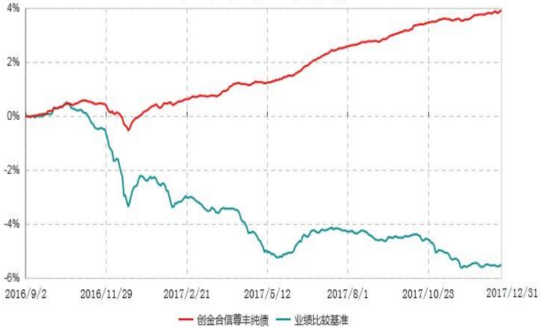
创金合信尊享纯债债券型证券投资基金累计净值增长率与业绩比较基准收益率历史走势对比图 (2016年09月02日-2017年12月31日)