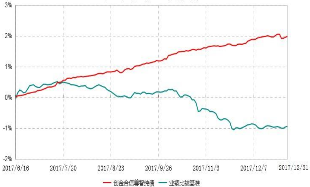
创金合信尊智纯债债券型证券投资基金累计净值增长率与业绩比较基准收益率历史走势对比图 (2017年06月16日-2017年12月31日)