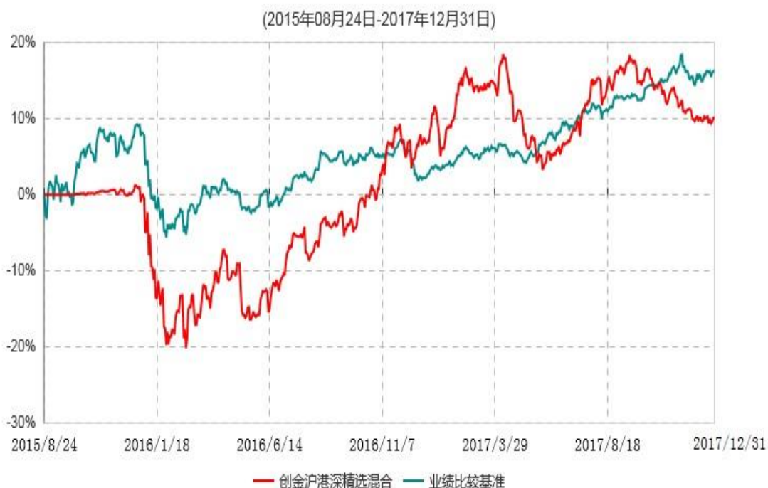
创金合信沪港深研究精选灵活配置混合型证券投资基金累计净值增长率与业绩比较基准收益率历史走势对比图