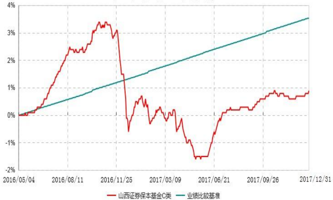
山西证券保本基金C类累计净值增长率与业绩比较基准收益率历史走势对比图 (2016年05月04日-2017年12月31日)