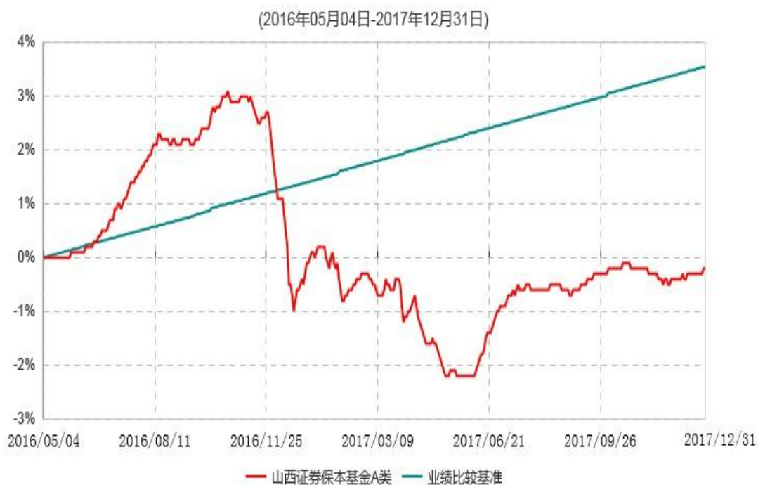
山西证券保本基金A类累计净值增长率与业绩比较基准收益率历史走势对比图

注：1、本基金基金合同生效日为2016年5月4日，至本报告期末，本基金运作时间未满三年；