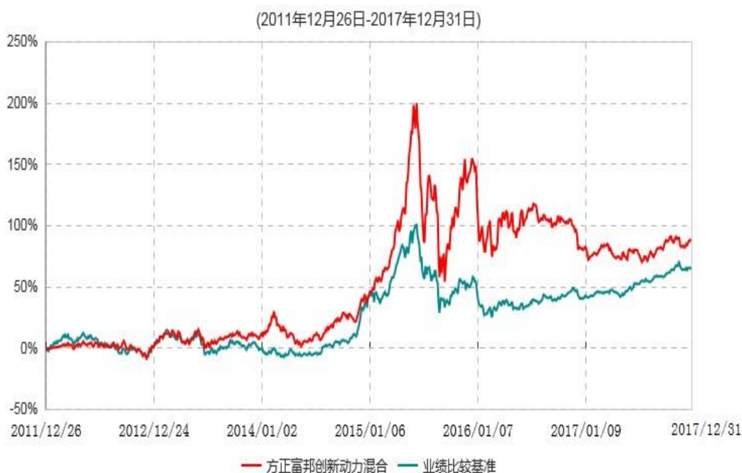
方正富邦创新动力混合型证券投资基金累计净值增长率与业绩比较基准收益率历史走势对比图