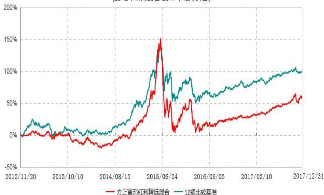
方正富邦红利精选混合型证券投资基金累计净值增长率与业绩比较基准收益率历史走势对比图 (2012年11月20日-2017年12月31日)