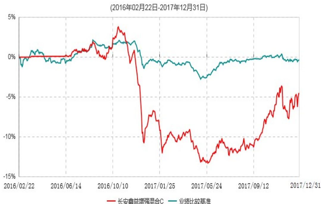
长安鑫益增强混合C累计净值增长率与业绩比较基准收益率历史走势对比图

本基金基金合同生效日为 2016 年 02 月 22 日，基金合同生效日至报告期期末，本基金运作时间超过一年。根据基金合同的规定，自基金合同生效之日起 6 个月内基金各项资产配置比例需符合基金合同要求。本基金在建仓期结束后，各项资产配置比例已符合基金合同有关投资比例的约定。图示日期为 2016 年 02 月 22 日至 2017 年 12 月 31 日。