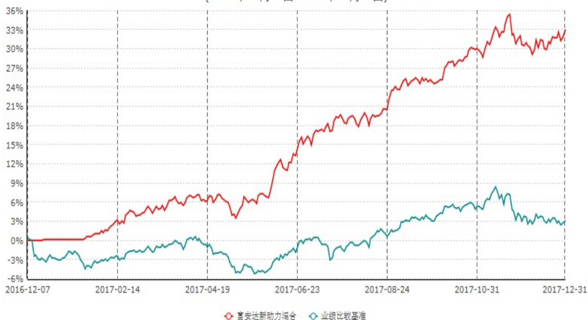
富安达新动力灵活配置混合型证券投资基金累计净值增长率与业绩比较基准收益率历史走势对比图 (2016年12月07日-2017年12月31日)