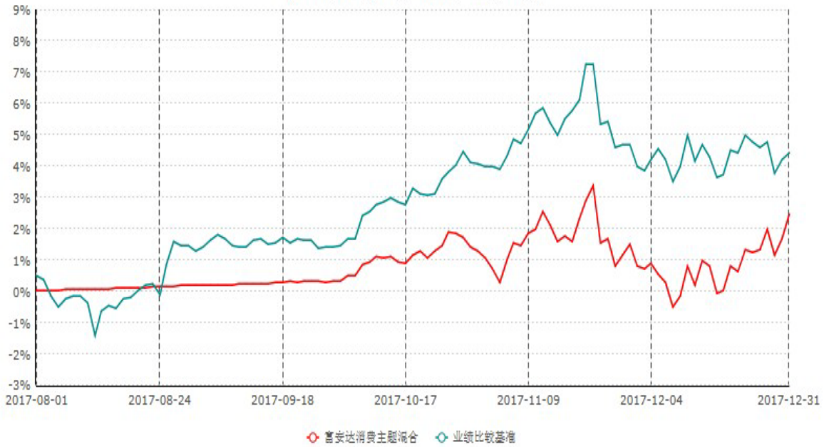
富安达消费主题灵活配置混合型证券投资基金累计净值增长率与业绩比较基准收益率历史走势对比图 (2017年08月01日-2017年12月31日)

本基金于2017年8月1日成立，截止本报告期末，本基金成立不满一年。本基金建仓期为本基金合同生效之日起六个月，截止本报告期末，本基金尚处于建仓期中。