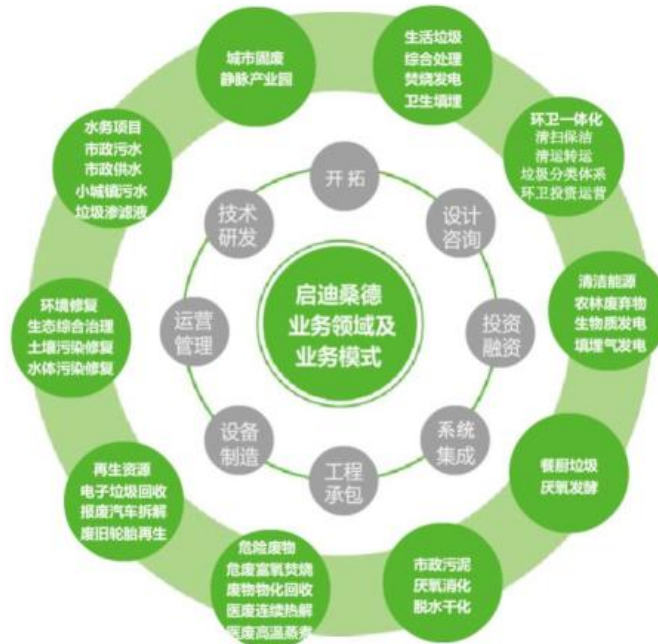
(三) 公司的业务领域及业务模式图表: