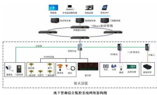
地下管廊综合监控系统网络架构图

提升了欧盟 CE 认证级别，参加了国际天然气工业设备及技术应用展览会，稳固和扩大了欧洲、独联体及中东市场，并通过满足客户个性化定制和多样化需求等形式，成功打入美洲市场，向着“做全球一流气体安全卫士”的企业理想稳步前行。