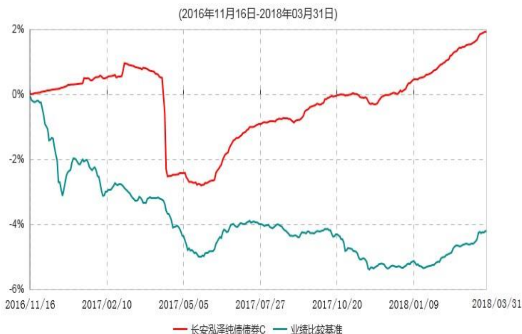
长安泓泽纯债债券C累计净值增长率与业绩比较基准收益率历史走势对比图

本基金基金合同生效日为 2016 年 11 月 16 日，按基金合同规定，本基金自基金合同生效起 6 个月为建仓期，截止到建仓期结束时，本基金的各项投资组合比例已符合基金合同的相关规定。基金合同生效日至报告期期末，本基金运作时间已满一年，图示日期为 2016 年 11 月 16 日至 2018 年 3 月 31 日。