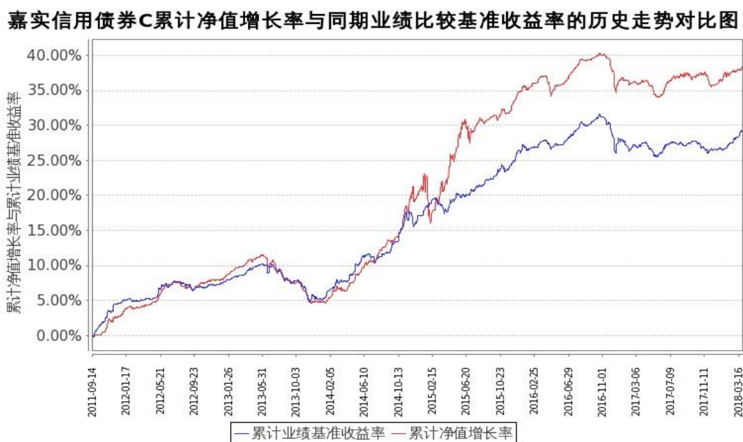
图 2: 嘉实信用债券 C 基金份额累计净值增长率与同期业绩比较基准收益率的历史走势对比图 (2011 年 9 月 14 日至 2018 年 3 月 31 日)

注: 按基金合同和招募说明书的约定, 本基金自基金合同生效日起 6 个月内为建仓期, 建仓期结束时本基金的各项投资比例符合基金合同(十四(二)投资范围和(七)投资禁止行为与限制 2. 基金投资组合比例限制)的有关约定。