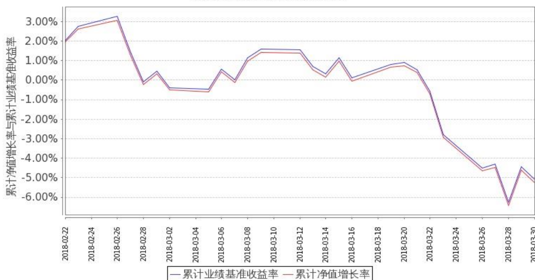
图 2：嘉实富时中国 A50ETF 联接基金 C 类基金份额累计净值增长率与同期业绩比较基准收益率的历史走势对比图