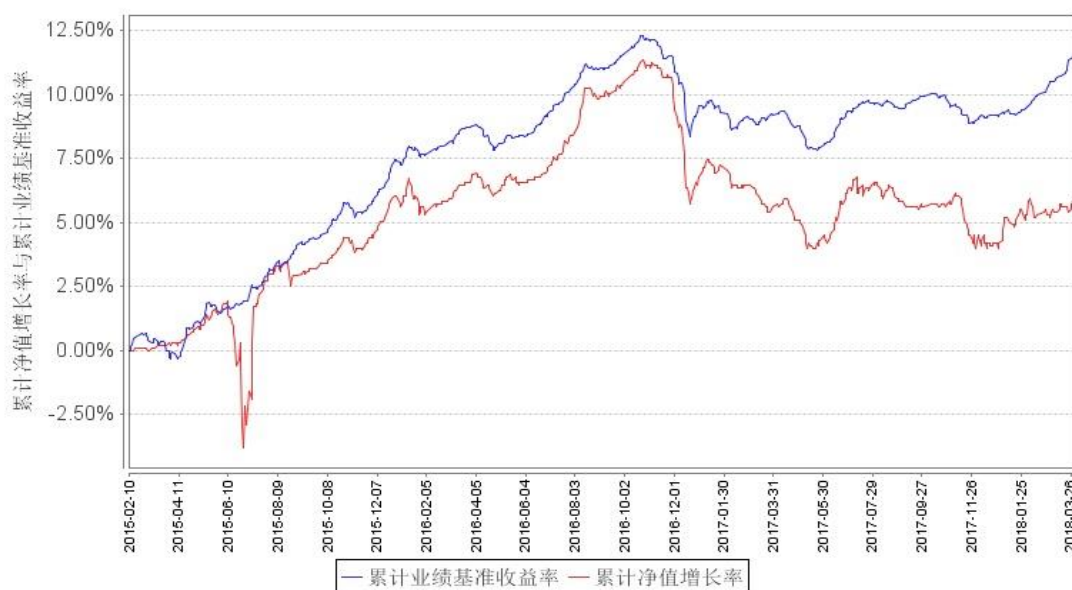
南方双元债券A累计净值增长率与同期业绩比较基准收益率的历史走势对比图