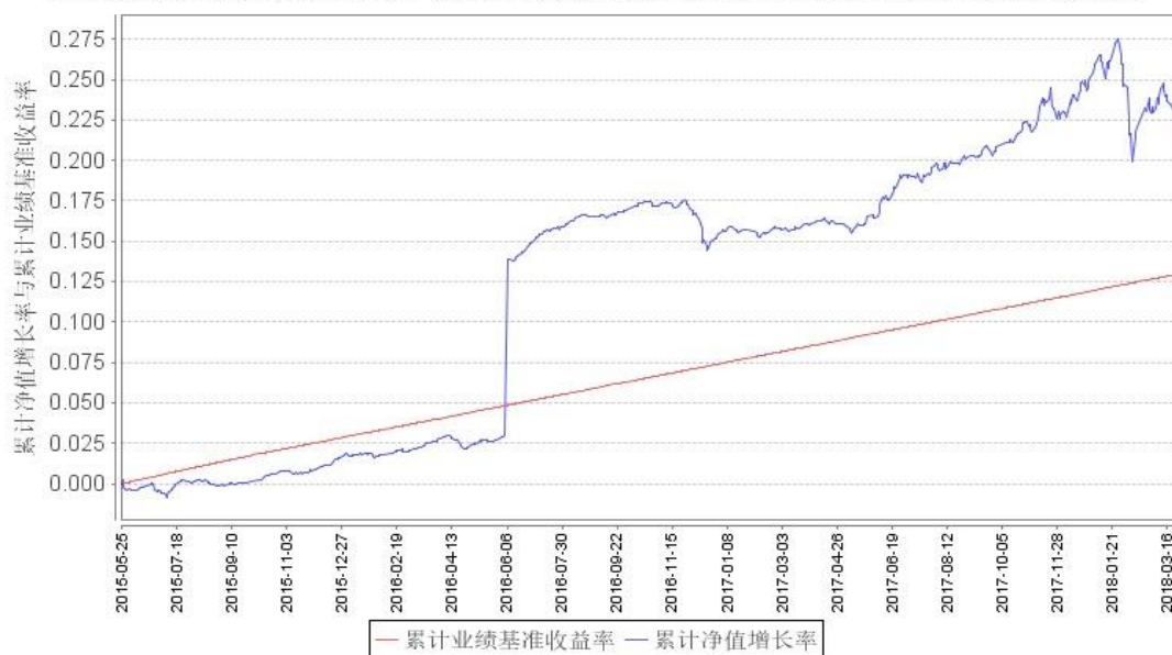
鹏华弘信混合A累计净值增长率与同期业绩比较基准收益率的历史走势对比图