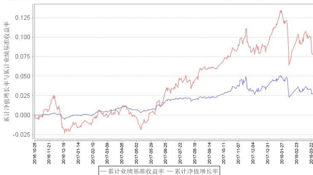
鹏华弘尚混合A类累计净值增长率与同期业绩比较基准收益率的历史走势对比图