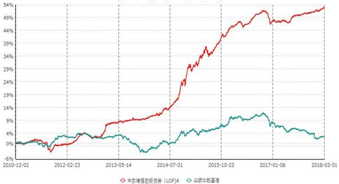
中欧增强回报债券（LOF）A累计净值增长率与业绩比较基准收益率历史走势对比图 (2010年12月02日-2018年03月31日)