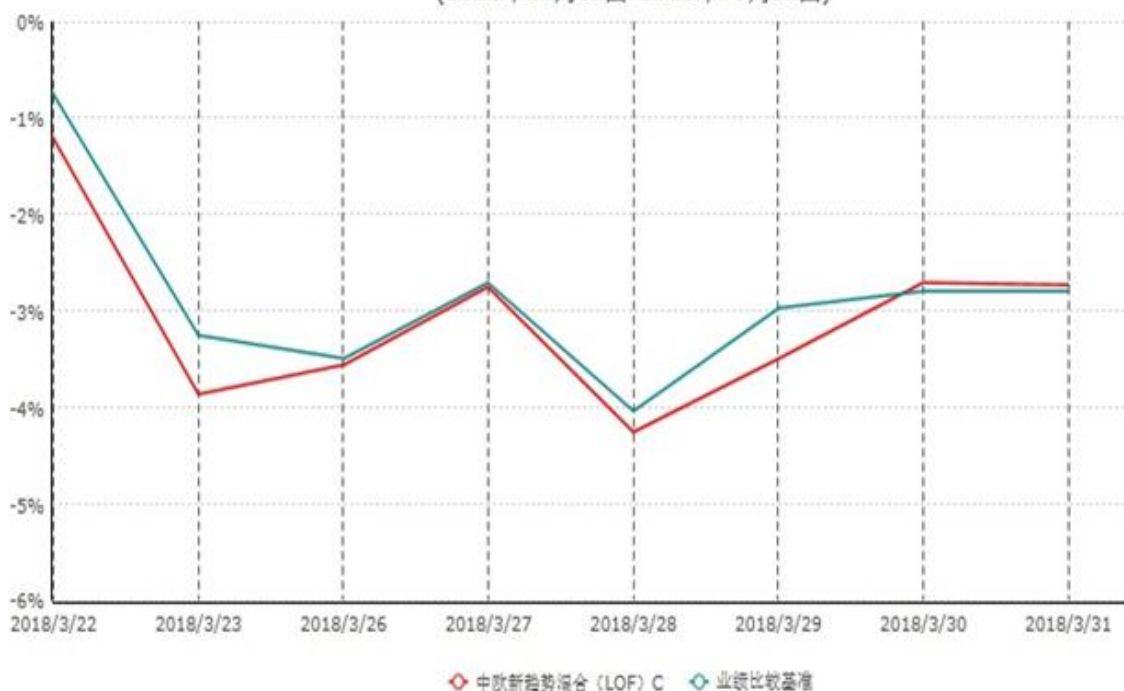
中欧新趋势混合（LOF）C累计净值增长率与业绩比较基准收益率历史走势对比图 (2018年03月21日-2018年03月31日)

注：本基金于2018年3月21日新增C类份额，图示日期为2018年3月22日至2018年03月31日。