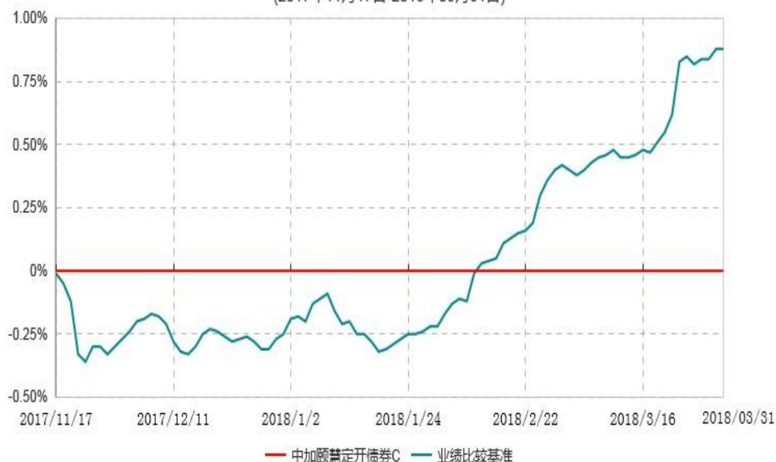
中加颐慧定开债券C累计净值增长率与业绩比较基准收益率历史走势对比图 (2017年11月17日-2018年03月31日)