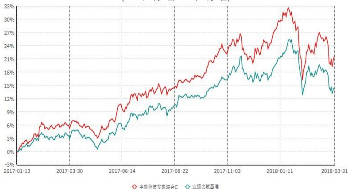
中欧价值发现混合C累计净值增长率与业绩比较基准收益率历史走势对比图 (2017年01月13日-2018年03月31日)

注：自 2017 年 1 月 12 日起，本基金新增 C 类份额，图示日期为 2017 年 1 月 13 日至 2018 年 3 月 31 日。