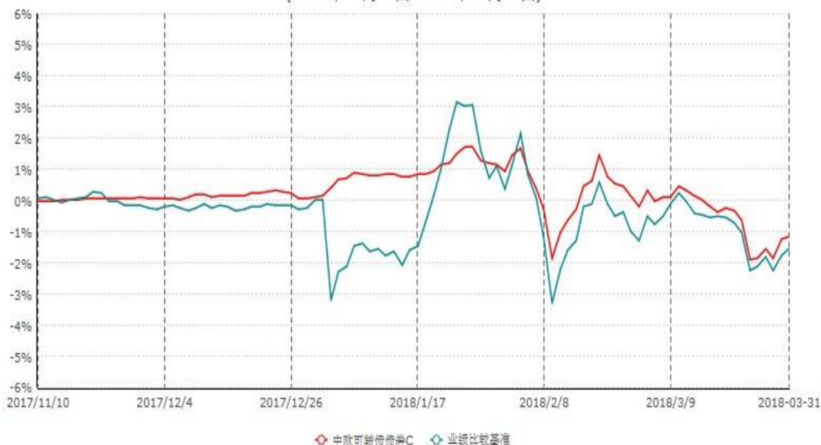
中欧可转债债券C累计净值增长率与业绩比较基准收益率历史走势对比图 (2017年11月10日-2018年03月31日)

注：本基金基金合同生效日期为 2017 年 11 月 10 日，自基金合同生效日起到本报告期末不满一年，按基金合同的规定，本基金自基金合同生效起六个月为建仓期，建仓期结束时各项资产配置比例应当符合基金合同约定。