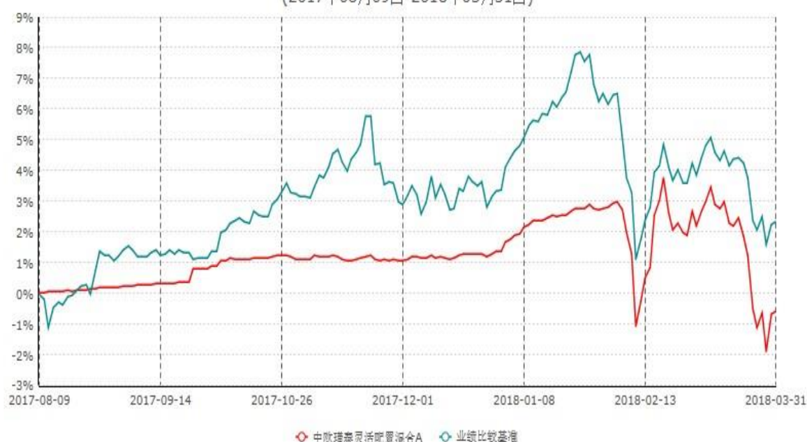
中欧瑾泰灵活配置混合A累计净值增长率与业绩比较基准收益率历史走势对比图 (2017年08月09日-2018年03月31日)

注：本基金基金合同生效日期为 2017 年 8 月 9 日，自基金合同生效日起到本报告期末不满一年，按基金合同的规定，本基金自基金合同生效起六个月为建仓期，建仓期结束时各项资产配置比例已符合基金合同约定。