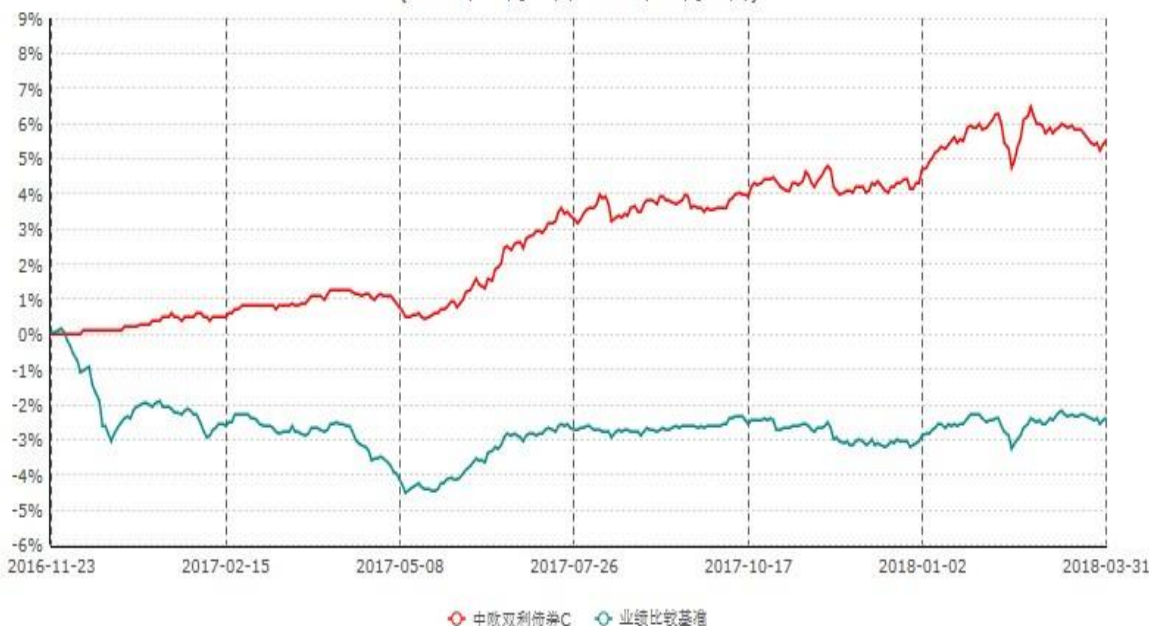
中欧双利债券C累计净值增长率与业绩比较基准收益率历史走势对比图 (2016年11月23日-2018年03月31日)

注：本基金基金合同生效日期为 2016 年 11 月 23 日，按基金合同的规定，本基金自基金合同生效起六个月为建仓期，建仓期结束时本基金的各项资产配置比例已达到基金合同的规定。