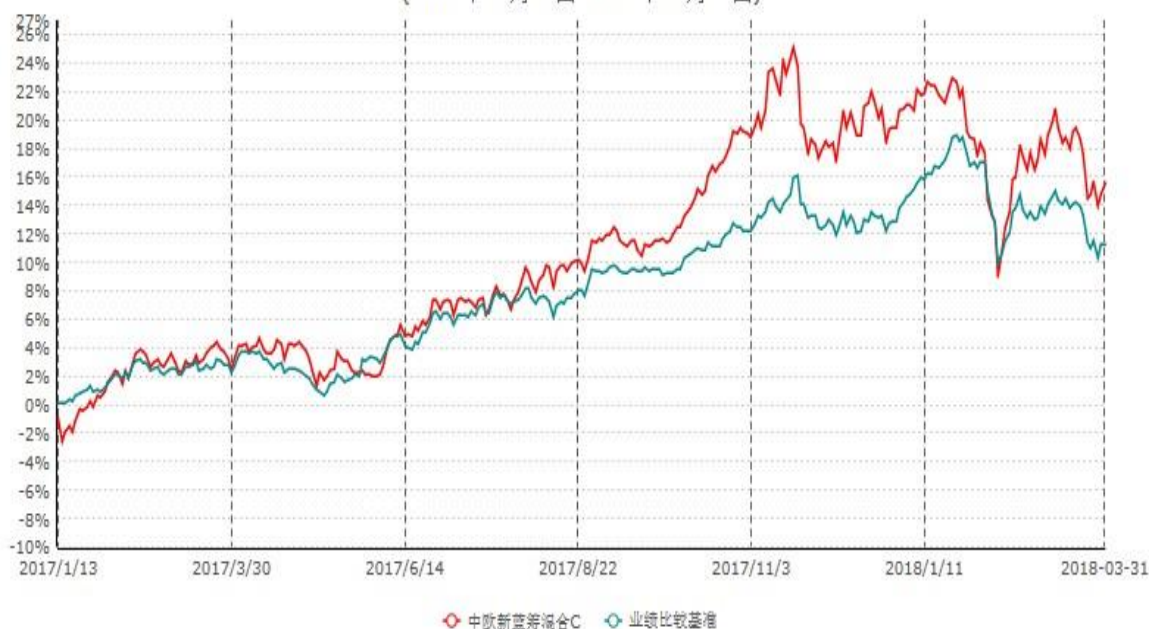
中欧新蓝筹混合C累计净值增长率与业绩比较基准收益率历史走势对比图 (2017年01月13日-2018年03月31日)

注：本基金于 2017 年 1 月 12 日新增 C 类份额，图示日期为 2017 年 1 月 13 日至 2018 年 3 月 31 日。