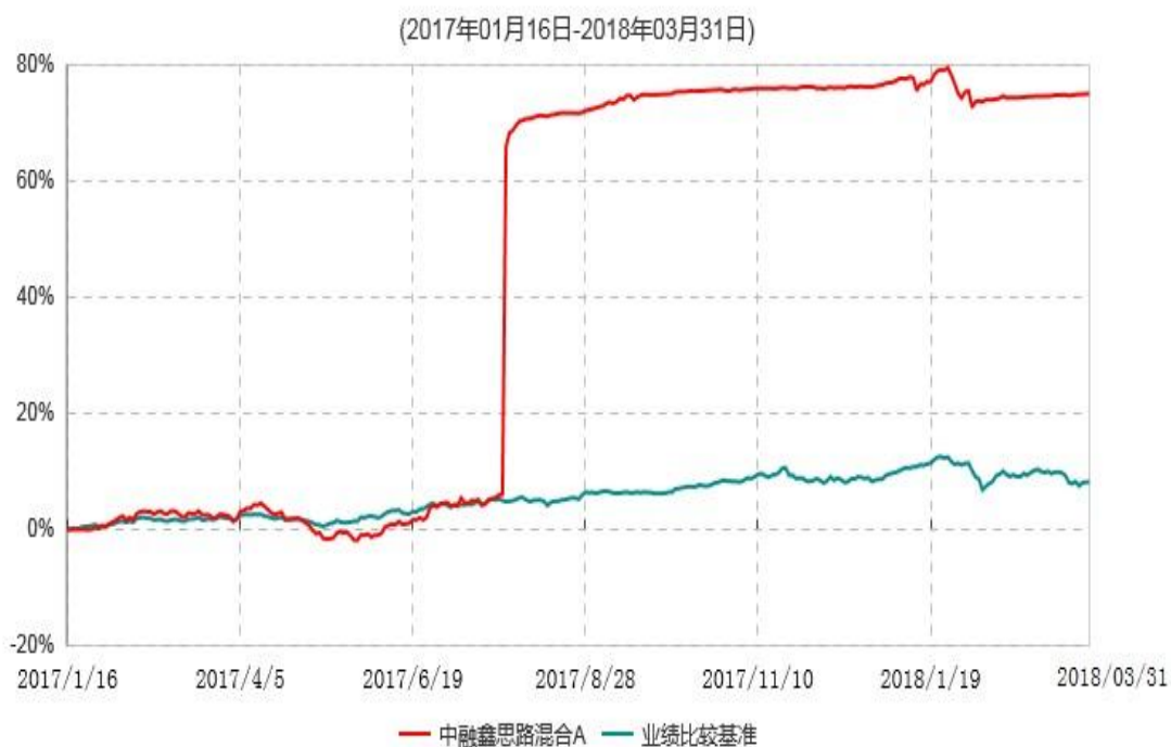
中融鑫思路混合A累计净值增长率与业绩比较基准收益率历史走势对比图