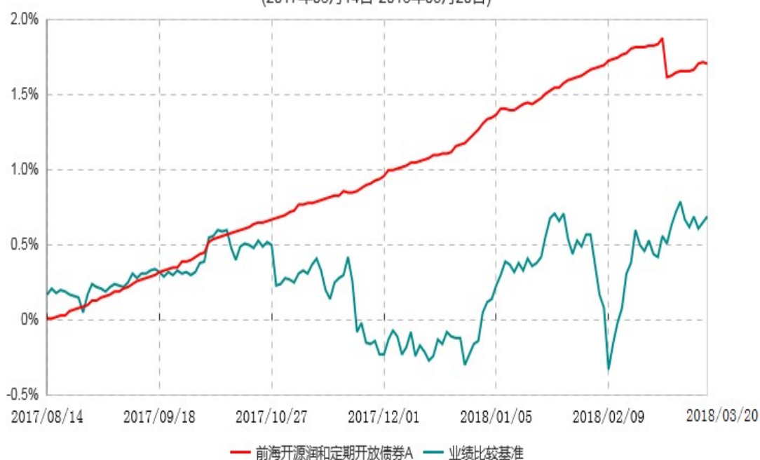
前海开源润和定期开放债券A累计净值增长率与业绩比较基准收益率历史走势对比图 (2017年08月14日-2018年03月20日)