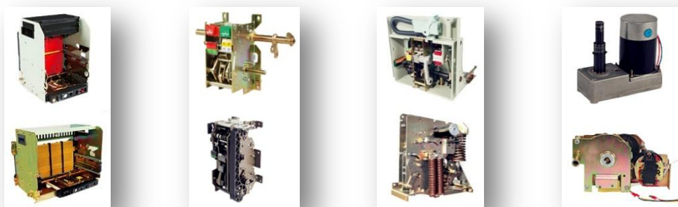
低压断路器（抽）架 低压断路器操作机构 中高压断路器操作机构 断路器附件