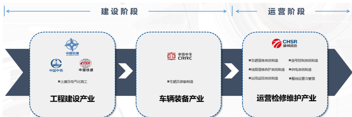
图2：轨道交通三大产业板块