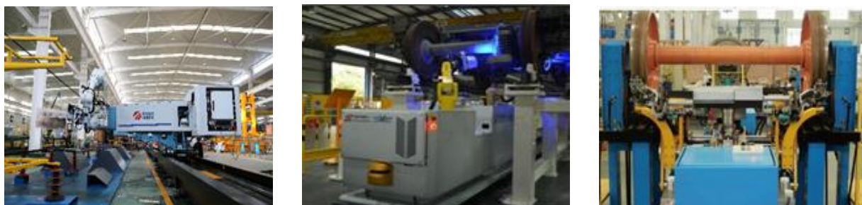
图4：检修机器人产品

2017年，公司自主研发的在线移动式轮辋轮辐探伤机器人、车底智能巡检机器人、车顶智能巡检机器人已通过铁路部门技术评审，面向铁路和城市轨道交通客户全面推广；空心轴探伤机器人、清洗机器人、瓷瓶擦拭机器人等研发工作也取得了初步成果。