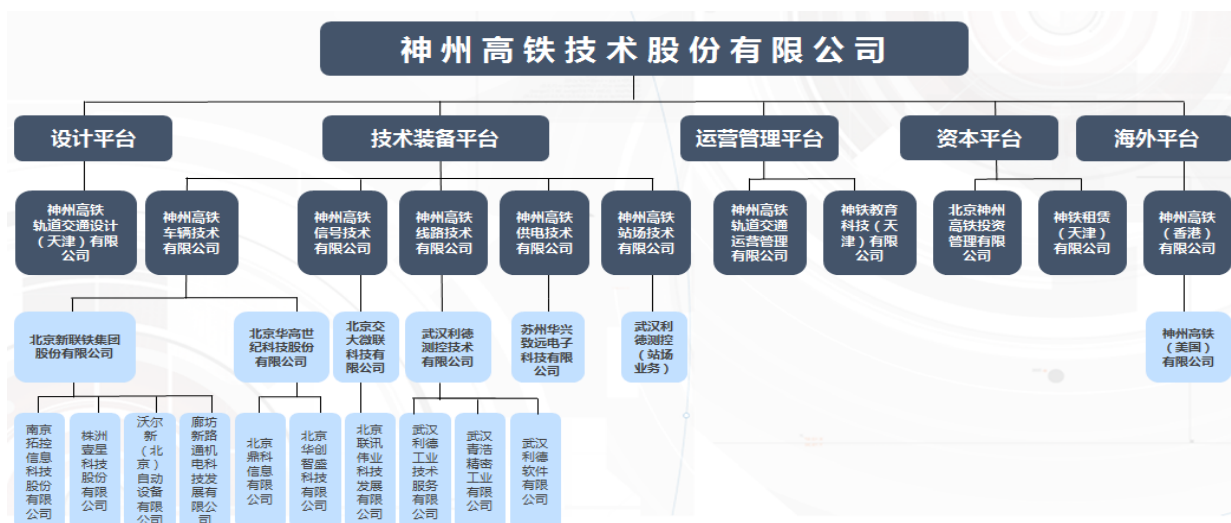
图1：公司战略组织架构图

公司专业提供轨道交通运营检修维护的全产业链系统及装备，并以此为依托，从事轨道交通规划投资、线路营运及商业管理服务，是中国轨道交通运营检修维护领域首家涵盖全产业链的上市公司。公司下设50余家子公司，拥有400余项轨道交通运营检修维护产品，广泛运用于车辆、信号、线路、供电、站场等专业领域，涉及轨道交通设计、投资、装备提供、运营、维护全生命周期，覆盖车辆维修体系装备（包括高铁车辆、城轨车辆、大功率机车全套检修维护系统装备）、信号体系装备（包括高铁、普铁以及城市轨道交通整条线路信号系统）、线路维修保养体系装备（包括高铁钢轨探伤检测、焊轨、铣磨以及城市轨道交通线路无人值守系统、钢轨铣磨等）、供电体系装备（如高铁供电6C体系、城市轨道交通供电检测监测等）以及站场体系装备（如高铁屏蔽门、货场信息化管理系统、车站监控安防系统等）。公司根据战略规划布局，建立了齐备的战略和组织管理体系。