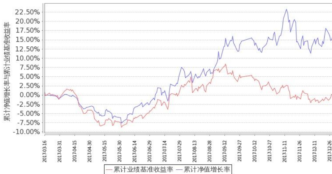
图 1：嘉实新能源新材料股票 A 基金累计份额净值增长率与同期业绩比较基准收益率的历史走势对比图