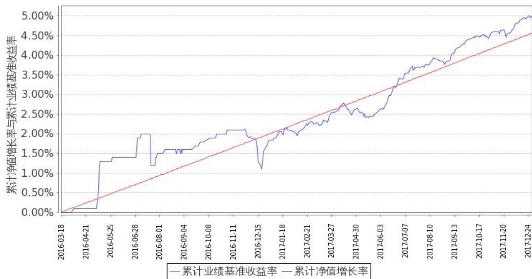
图：嘉实稳祥纯债债券 A 基金份额累计净值增长率与同期业绩比较基准收益率的历史走势对比图