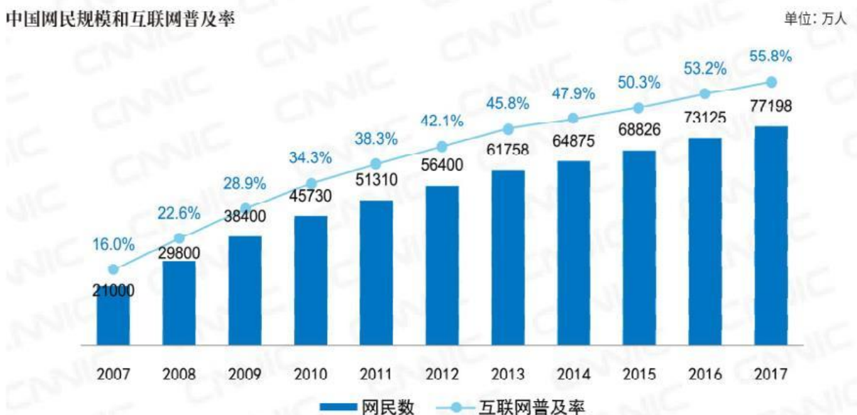
中国网民规模和互联网普及率

随着我国信息基础设施和网络技术的不断完善,互联网行业飞速发展。根据中国互联网络信息中心(CNNIC)发布的《第 41 次中国互联网络发展状况统计报告》显示,截至 2017 年 12 月,我国网民规模达 7.72 亿,普及率达到 55.8%,较 2016 年底提升 2.6%。全年共计新增网民 4074 万人,截至 2017 年 12 月,我国手机网民规模达 7.53 亿,较 2016 年底增加 5734 万人。网民中使用手机上网人群的占比由 2016 年的 95.1%提升至 97.5%。