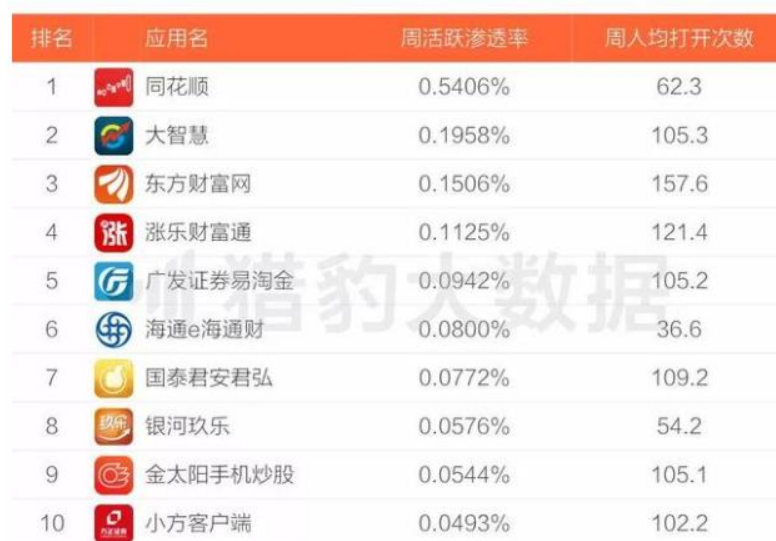
猎豹大数据 – 2017年度证券交易类app排行榜

排名依据：周活跃渗透率。周活跃用户渗透率=app的周活跃用户数/中国市场总周活跃用户数。 周人均打开次数：用户平均每周打开app的次数。数据区间：2017.12.25-2017.12.31。安卓端数据。