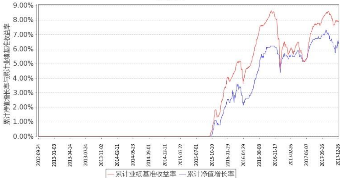
图 2：嘉实增强收益定期债券 C 基金份额累计净值增长率与同期业绩比较基准收益率的历史走势对比图