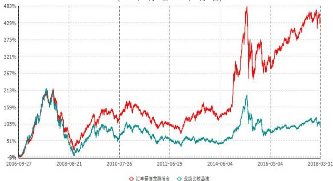
汇丰晋信龙腾混合型证券投资基金累计净值增长率与业绩比较基准收益率历史走势对比图 (2006年09月27日-2018年03月31日)