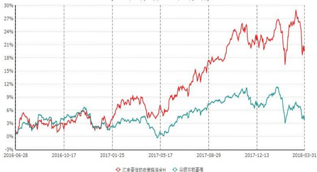
汇丰晋信动态策略混合H累计净值增长率与业绩比较基准收益率历史走势对比图 (2016年06月28日-2018年03月31日)