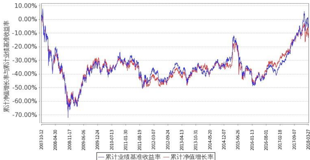
图：嘉实海外中国股票混合(QDII)基金份额累计净值增长率与同期业绩比较基准收益率的历史走势对比图