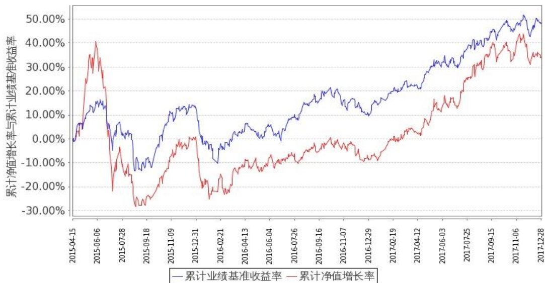
嘉实全球互联网股票型证券投资基金-美元累计净值增长率与同期业绩比较基准收益率的历史走势对比图