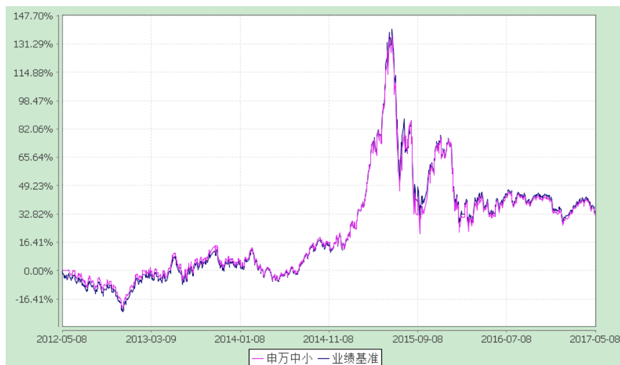
(2) 申万菱信中小板指数证券投资基金 (LOF) 累计份额净值增长率与业绩比较基准收益率的历史走势对比图