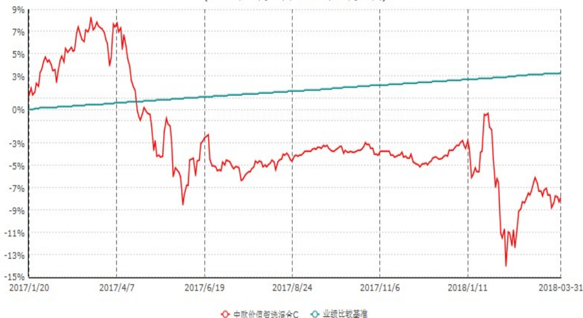
中欧价值智选混合C累计净值增长率与业绩比较基准收益率历史走势对比图 (2017年01月20日-2018年03月31日)

注：本基金自2017年1月19日起增加C份额，图示为2017年1月20日至2018年03月31日。