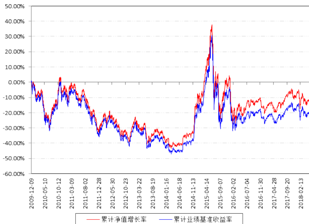
深成联接A累计净值增长率与同期业绩比较基准收益率的历史走势对比图