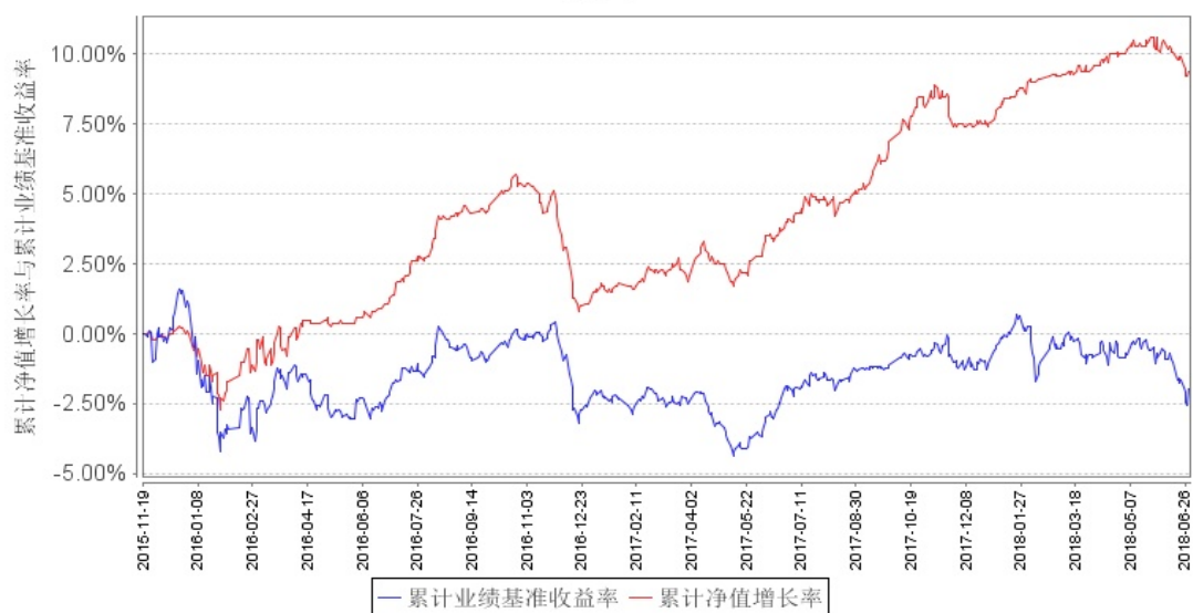
南方荣光灵活配置混合A累计净值增长率与同期业绩比较基准收益率的历史走势对比图