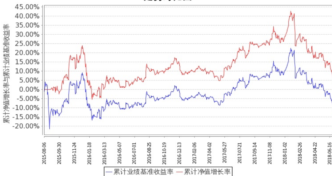
图：嘉实中证金融地产 ETF 联接 A 基金份额累计净值增长率与同期业绩比较基准收益率的历史走势对比图 (2015 年 8 月 6 日至 2018 年 6 月 30 日)