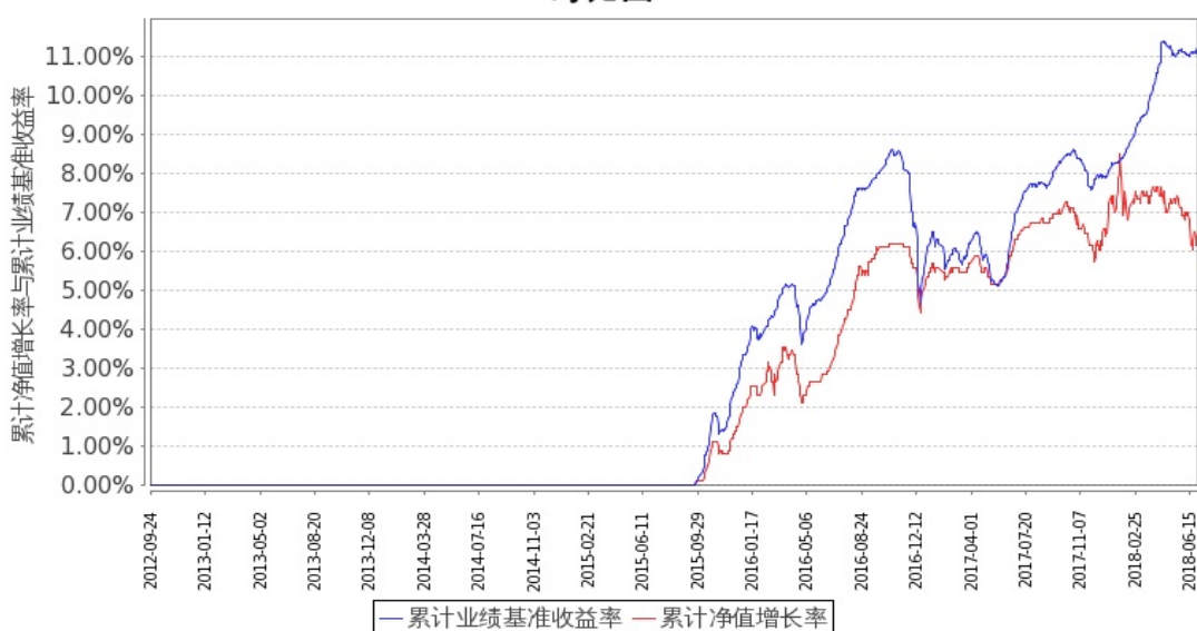
图 2：嘉实增强收益定期债券 C 基金份额累计净值增长率与同期业绩比较基准收益率的