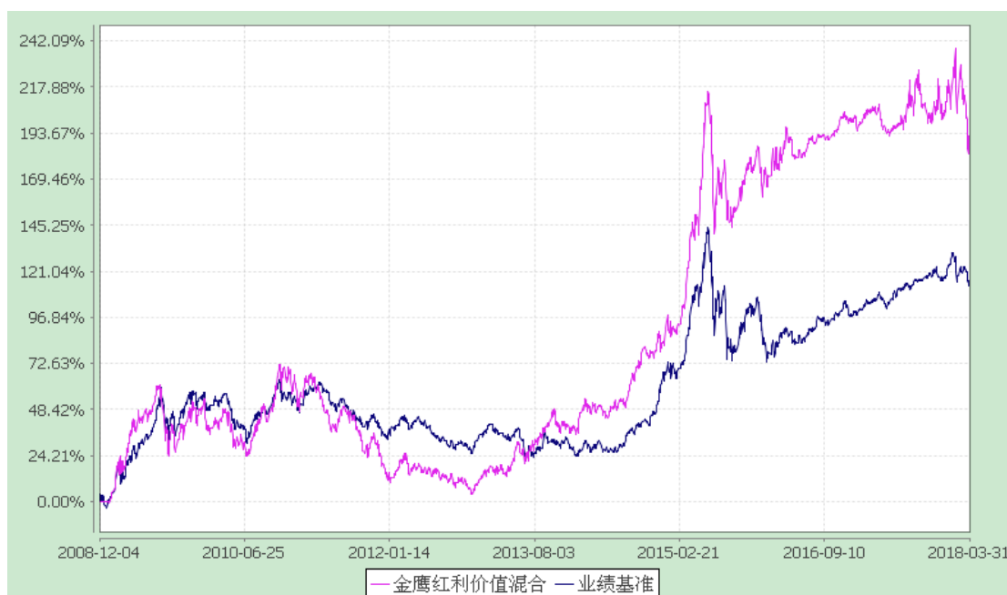
金鹰红利价值灵活配置混合型证券投资基金 累计净值增长率与业绩比较基准收益率历史走势对比图 (2008 年 12 月 4 日至 2018 年 3 月 31 日)