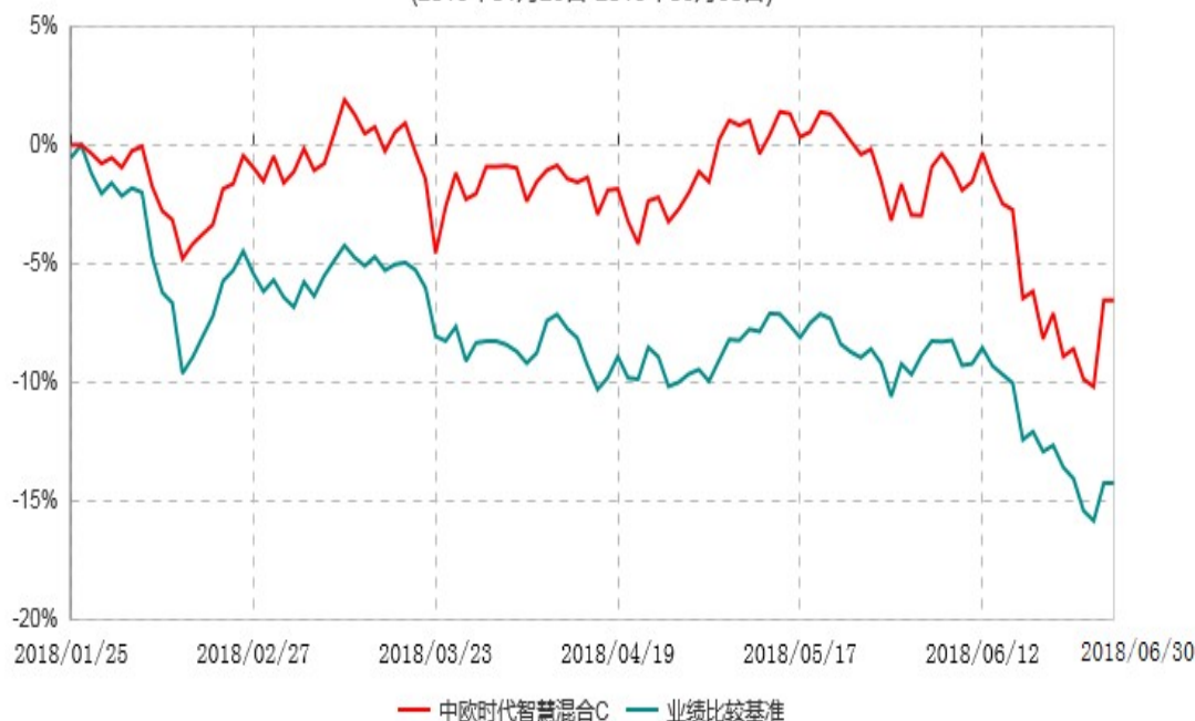
中欧时代智慧混合C累计净值增长率与业绩比较基准收益率历史走势对比图 (2018年01月25日-2018年06月30日)

注：本基金基金合同生效日期为 2018 年 1 月 25 日，自基金合同生效日起到本报告期末不满一年，按基金合同的规定，本基金自基金合同生效起六个月为建仓期，建仓期结束时各项资产配置比例应当符合基金合同约定。