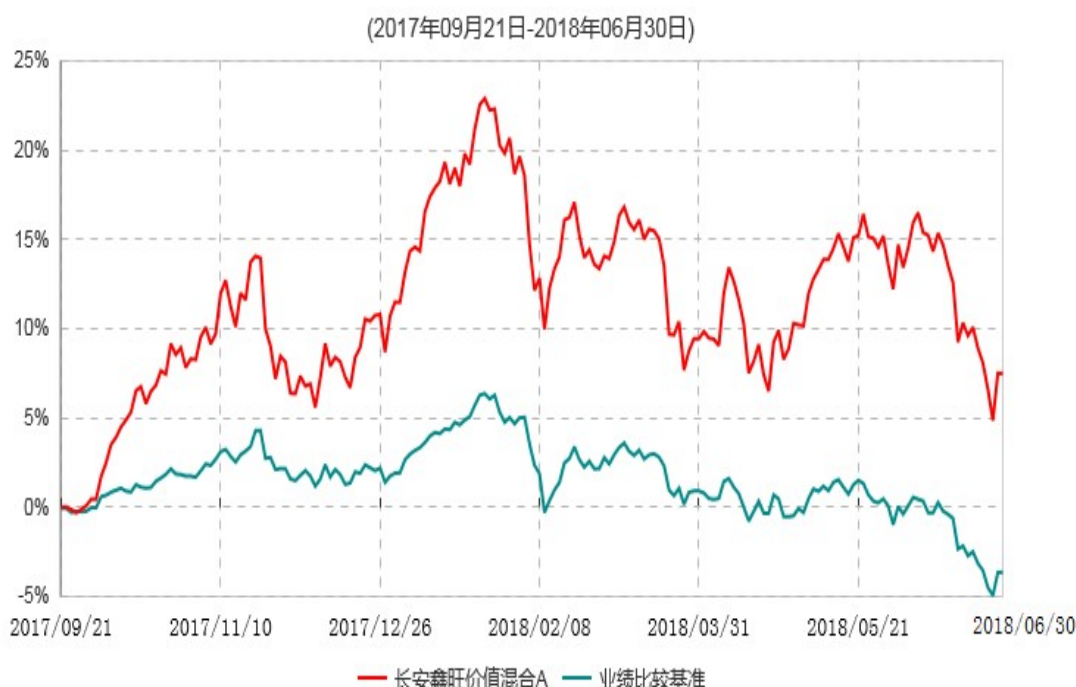
长安鑫旺价值混合A累计净值增长率与业绩比较基准收益率历史走势对比图

根据基金合同的规定,自基金合同生效之日起 6 个月内基金各项资产配置比例需符合基金合同要求。本基金在建仓期结束后,各项资产配置比例已符合基金合同有关投资比例的约定。基金合同生效日至报告期末,本基金运作时间未满一年。图示日期为 2017 年 9 月 21 日至 2018 年 06 月 30 日。