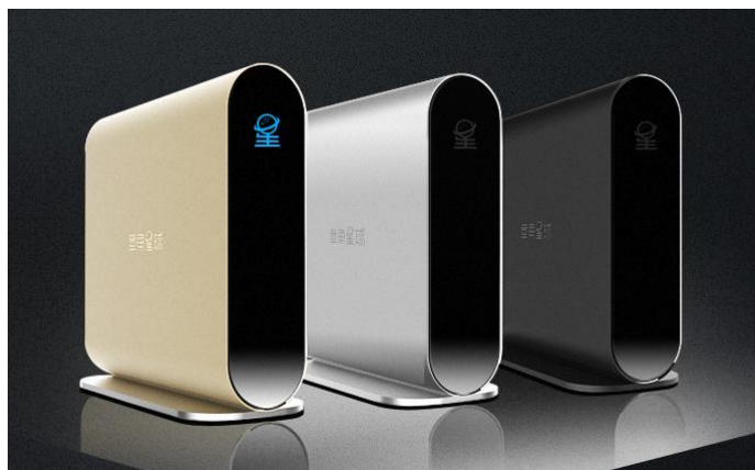
(图为2345星球联盟的智能终端硬件产品“章鱼星球”)

2345.com具有较为完善的多元化、多层次产品体系，既满足了用户多元化需求，又充分发挥了各产品之间优势互补的特点，增强了抵御风险的能力。截至目前，公司的PC端软件产品有2345加速浏览器、2345看图王、2345好压、2345王牌输入法、2345安全卫士；移动端产品有2345手机浏览器、2345王牌手机助手、2345天气王、2345网址导航APP，此外，公司开发并运营了2345网址导航桌面版、2345影视大全桌面版、PDF阅读器、2345游戏盒子等小工具，并推出了基于区块链技术的“2345星球联盟”。各产品线间加强联动效应，深度挖掘用户价值，提升了单个用户贡献值。截至报告期末，2345好压压缩软件是国内装机量最大的免费压缩软件；2345加速浏览器在国内浏览器中排名第三，仅次于360浏览器及QQ浏览器；2345输入法用户数较2017年同期有显著增长；“2345星球联盟”的智能终端产品“章鱼星球”在报告期内已经开始对外销售，用户购买热情较高。